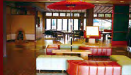
ロビー / Lobby