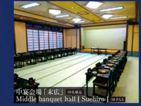
中宴会場「未広」 50名様迄 Middle banquet hall [ Suehiro ] 50 PAX