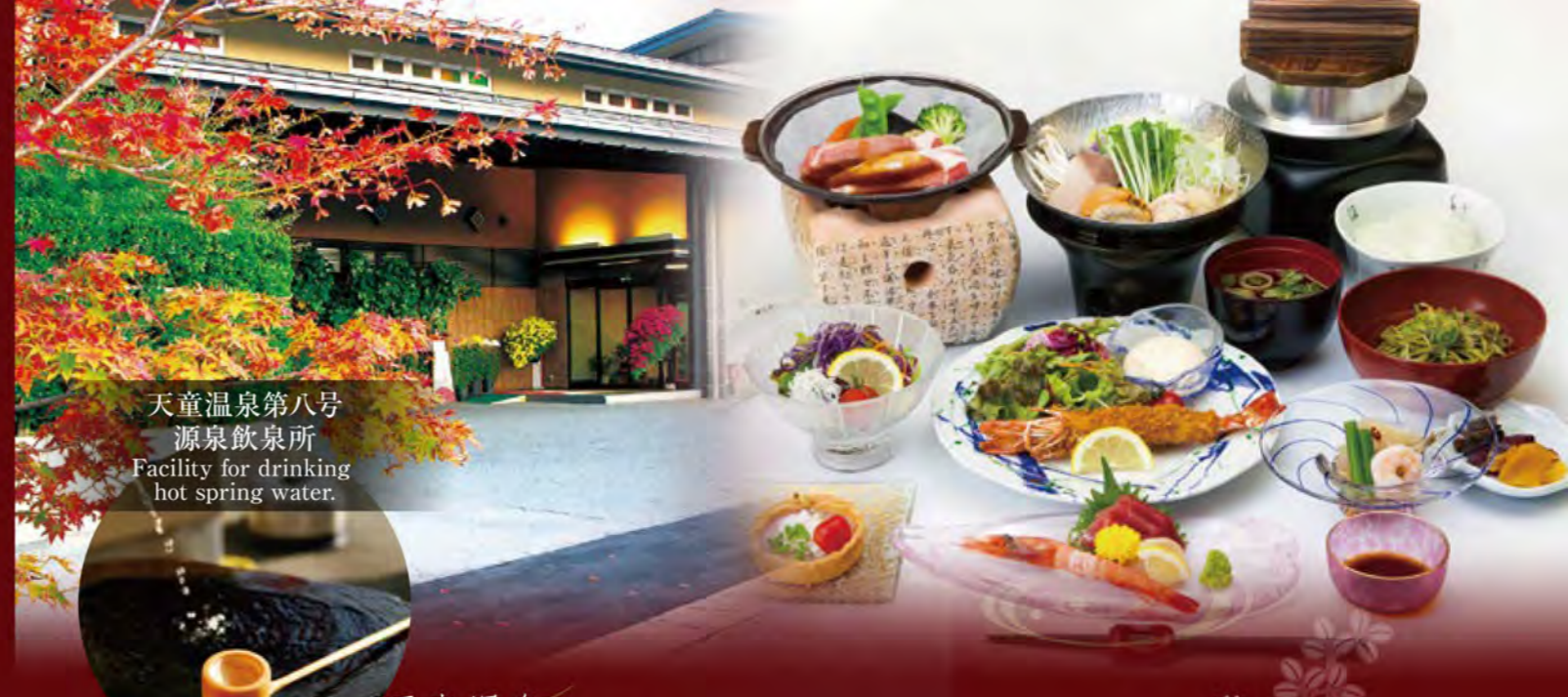
天童温泉第八号 源泉飲泉所 Facility for drinking hot spring water.