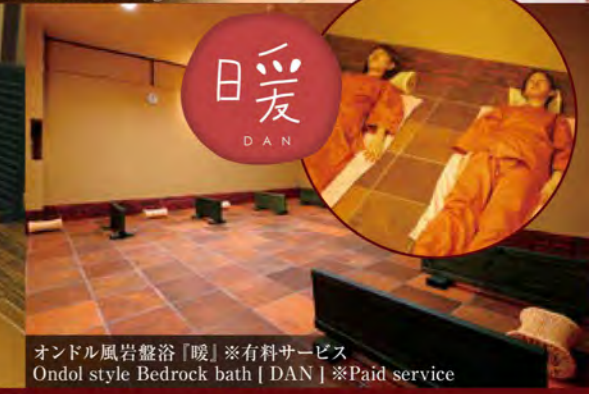
オンドル風岩盤浴「暖」※有料サービス Ondol style Bedrock bath [DAN] ※Paid service