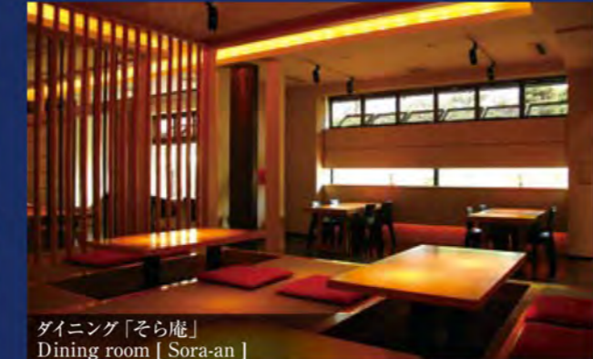
ダイニング「そら庵」 Dining room [ Sora-an ] 中庭を眺めながらお食事ができるお席や、掘り炬燵席、テーブル席、個室など、全13テーブルのダイニングです。