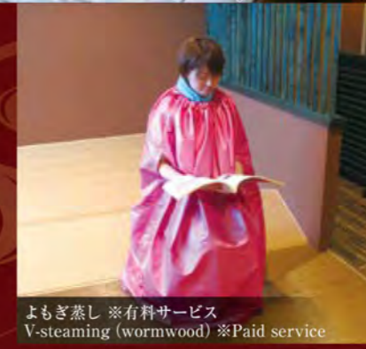
よもぎ蒸し ※有料サービス V-steaming (wormwood) ※Paid service

敷地内の源泉からこんこんと湧き出る無色透明の湯は、飲湯もできる良質の源泉です。さらりとした肌触りで美肌・保湿効果があります。男女一緒に寝ころんで寛く、オンドル風岩盤浴「暖(DAN)」はカップルやファミリーのお客様におすすめです。