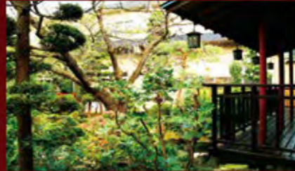
中庭 / Garden