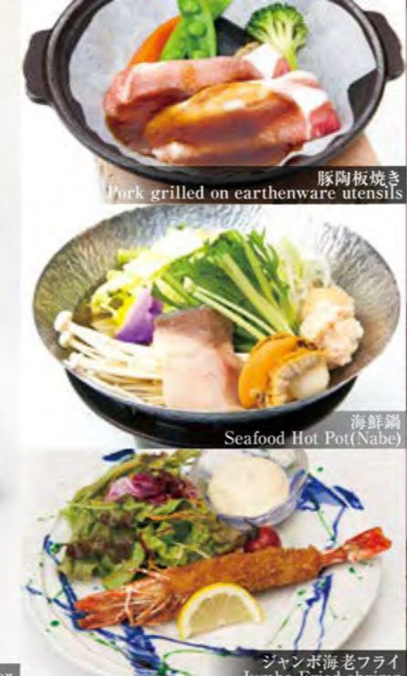
夕食(一例) / Dinner ※The menu may change, according to the season.