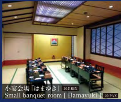
小宴会場「はまゆき」 20名様迄 Small banquet room [ Hamayuki ] 20 PAX