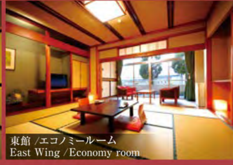
東館 / エコノミールーム East Wing / Economy room