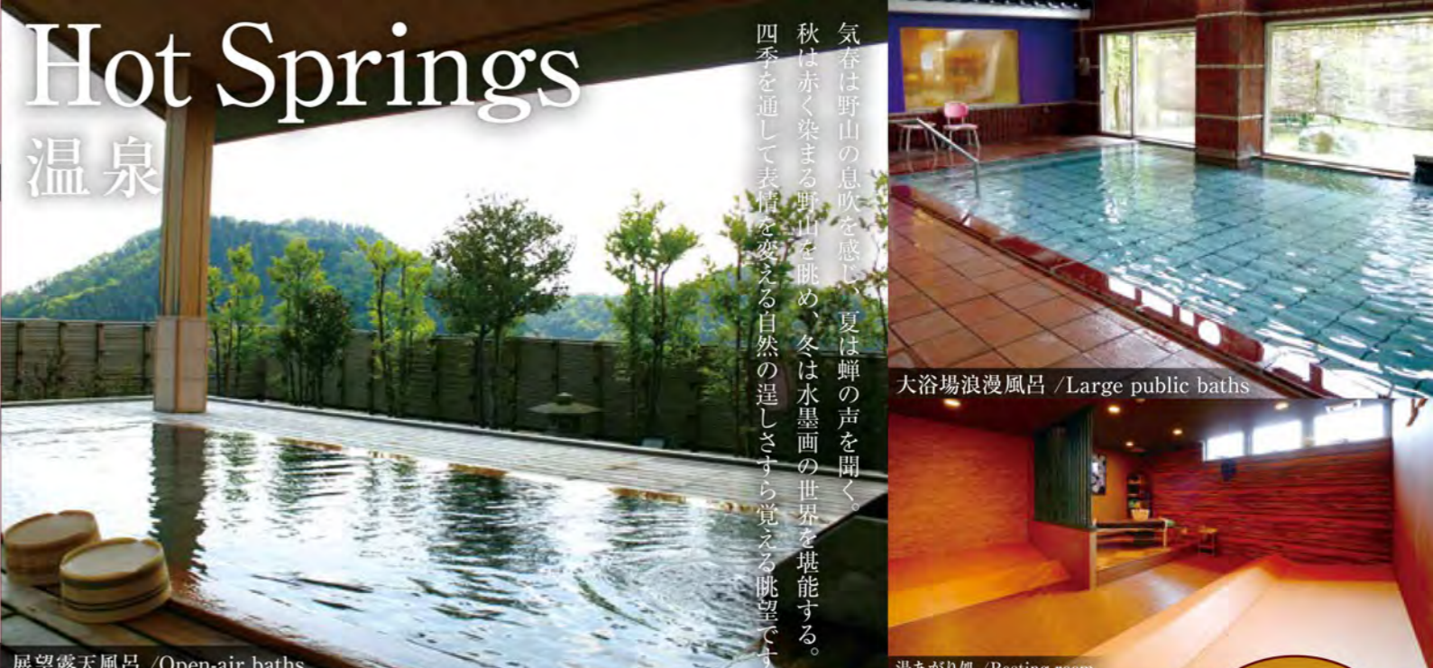
展望露天風呂 / Open-air baths

気春は野山の息吹を感じ、夏は蝉の声を聞く。秋は赤く染まる野山を眺め、冬は水墨画の世界を堪能する。四季を通して表情を変える自然の逞しさすら覚える眺望です。