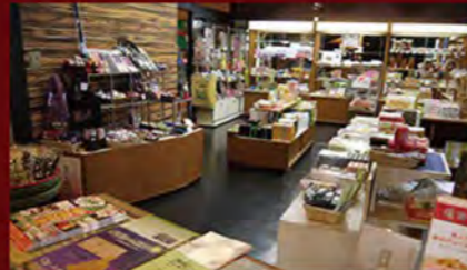
売店 / Gift shop