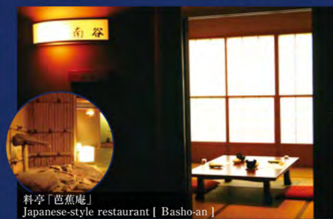
料亭「芭蕉庵」 Japanese-style restaurant [ Basho-an ] 芭蕉の詩にちなんだ名が付いた、それぞれ趣きの異なる7つの個室お食事処です。