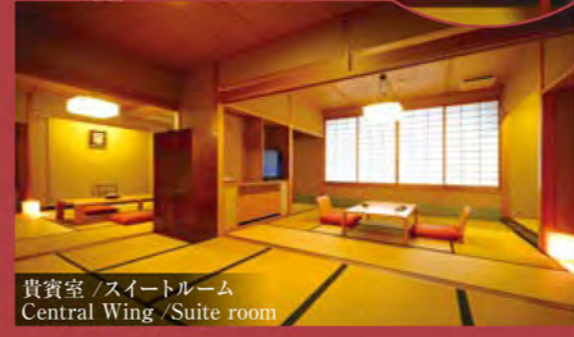
貴賓室 / 스위트ルーム Central Wing / Suite room