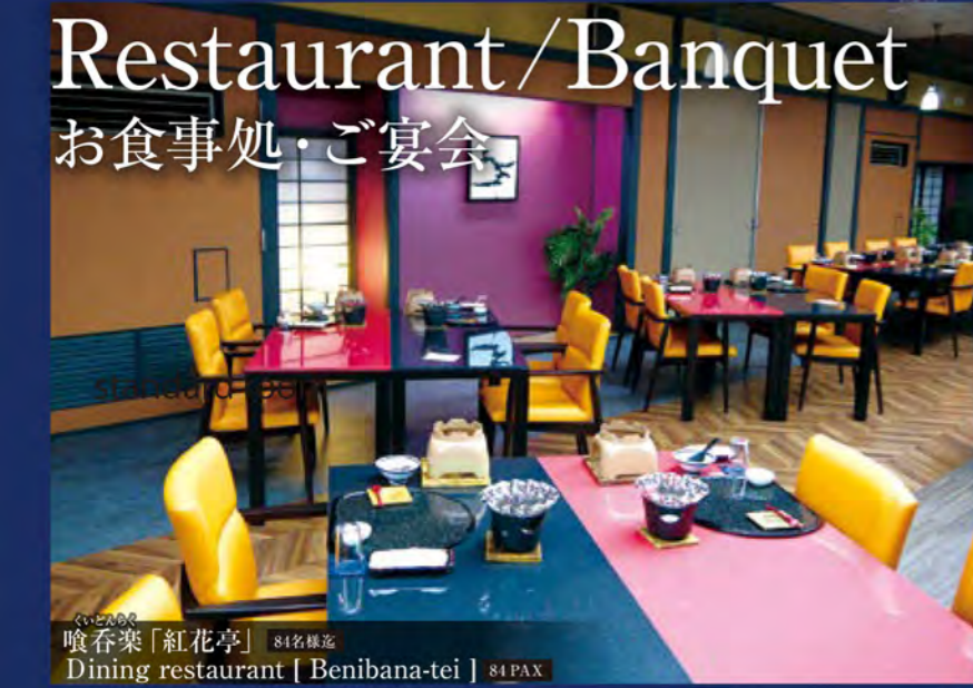
喰呑楽「紅花亭」 84名様迄 Dining restaurant [ Benibana-tei ] 84 PAX