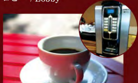
喫茶コーナー (セルフサービス) There is a coffee for free (self-service) at the lounge.