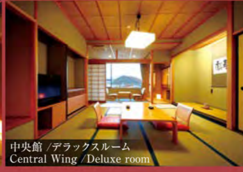
中央館 / デラックスルーム Central Wing / Deluxe room