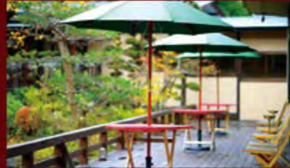
テラス / Terrace