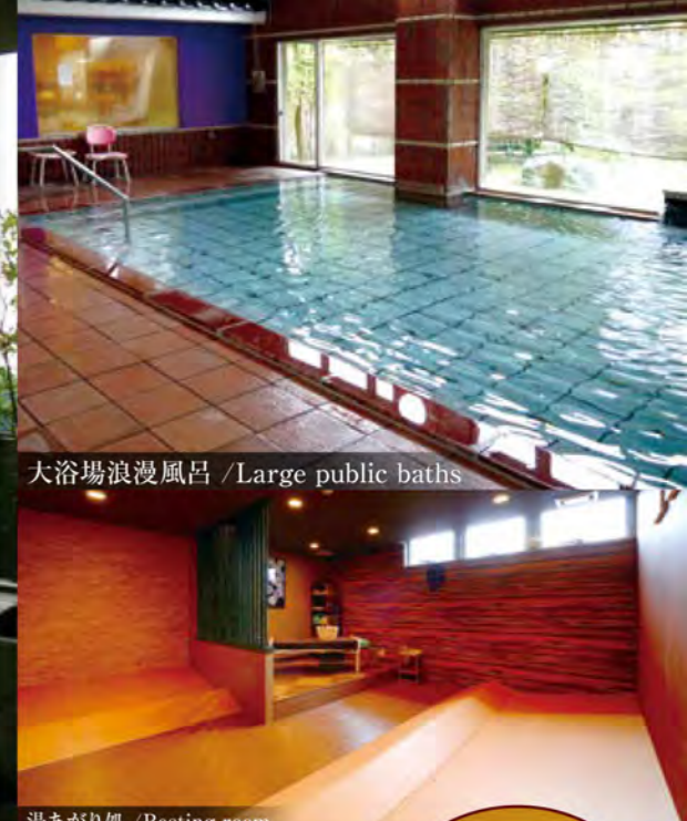
大浴場浪漫風呂 / Large public baths

気春は野山の息吹を感じ、夏は蝉の声を聞く。秋は赤く染まる野山を眺め、冬は水墨画の世界を堪能する。四季を通して表情を変える自然の逞しさすら覚える眺望です。