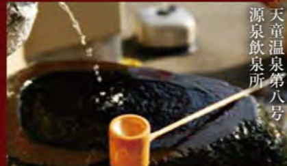
飲泉処 / Facility for drinking hot spring water